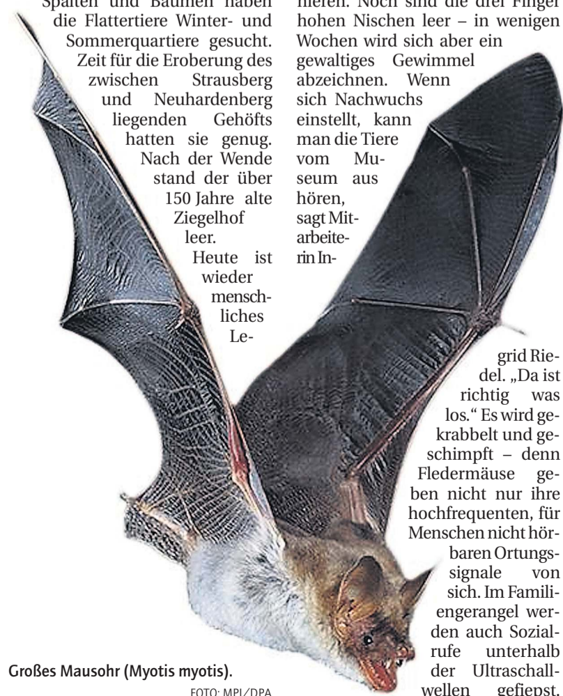
Großes Mausohr ( Myotis myotis ).

Info Internationales Fledermausmuseum, Julianenhof 15 B, 15377 Märkische Höhe. Geöffnet Mai bis Oktober täglich von 10 bis 16 Uhr, Eintritt frei. Termine und weitere Infos unter www.fledermausmuseum-julianenhof.de .