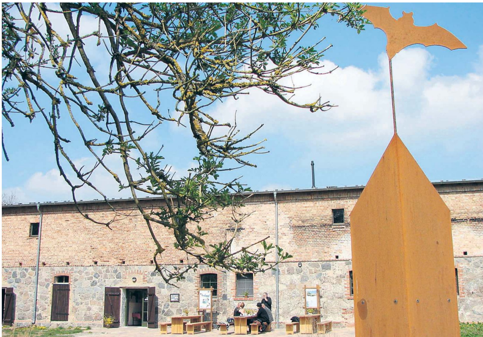
Ein Ausflug in die Natur – das internationale Fledermausmuseum bietet Platz für Fledermäuse, interessierte Besucher und ruhige Stunden im Grünen.

grid Riedel. „Da ist richtig was los.“ Es wird gekrabbel und geschimpft – denn Fledermäuse geben nicht nur ihre hochfrequenten, für Menschen nicht hörbaren Ortungssignale von sich. Im Familiengerangel werden auch Sozialrufe unterhalb der Ultraschallwellen gepflegt.